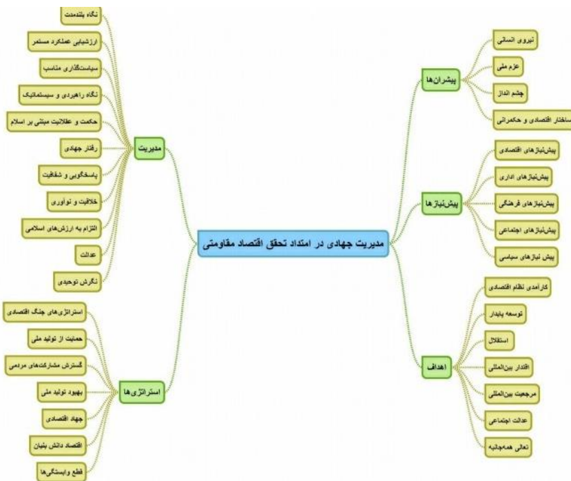
شکل ۳. شبکه مضامین مدل مدیریت جهادی در امتداد اقتصاد مقاومتی