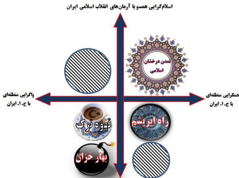
اسلام گرایی همسو با اندیشه های سکولار - اسلام گرایی همسو با اندیشه تکفیری

با توجه به آینده های باورپذیر تحولات بیداری اسلامی در آسیای مرکزی، فضای سناریوهای بیداری اسلامی در آسیای مرکزی به شکل ۱ ترسیم شده است.