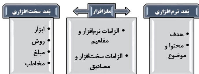
شکل ۱: ارکان و اجزای نظام تبلیغ فرهنگی