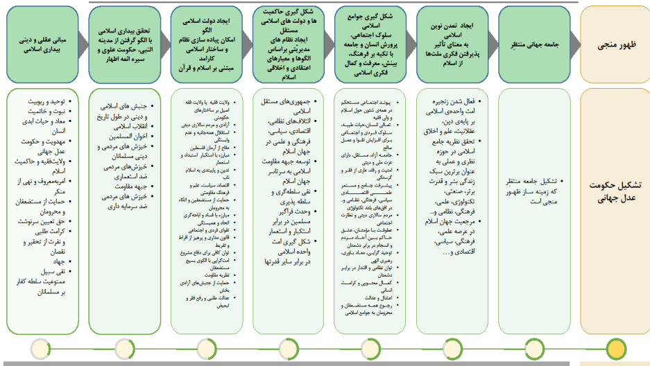
شکل ۳. چارچوب نظری تحقیق "مبانی و افق پیش روی بیداری اسلامی"

مطلوبیت‌ها و همچنین شناسایی و تحلیل کلان‌روندها و تطبیق مطلوبیت‌ها با روندها برای شناخت روند مطلوب کاملاً کیفی است. گردآوری اطلاعات با شیوه ترکیبی (کتابخانه‌ای و میدانی) صورت گرفته است. همچنین تجزیه و تحلیل اطلاعات با روش میانگین رتبه‌ای و با استفاده از آزمون فریدمن با نرم‌افزار «SPSS» انجام شده و سنجش میزان پایایی یافته‌های تحقیق نیز با آزمون آلفای کرونباخ استخراج شده است.