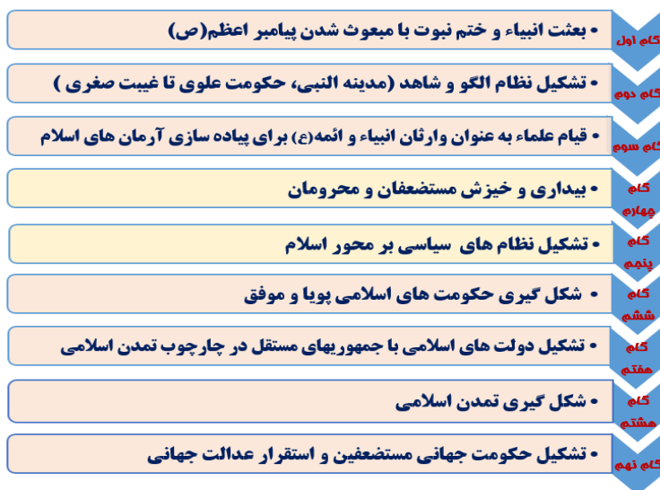
شکل ۲. «سیر حرکت تکاملی جوامع اسلامی از خاتمیت تا مهدویت»