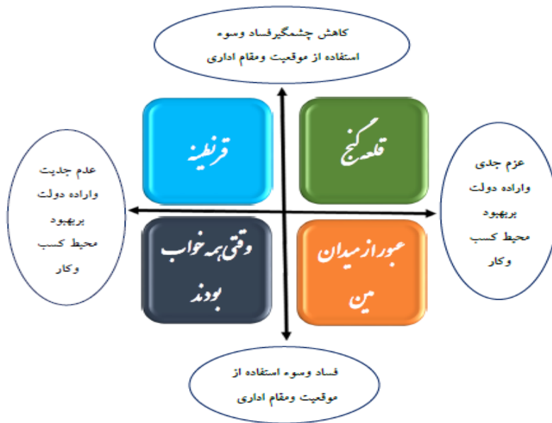
نمودار شماره ۲- سناریوهای چهارگانه